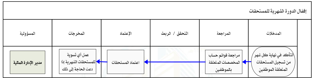
شكل رقم / ٥

يوضح المخطط البياني التالي ( شكل رقم/٥) طريقة تسلسل العمل لإقفال الدورة الشهرية للمستحقات: