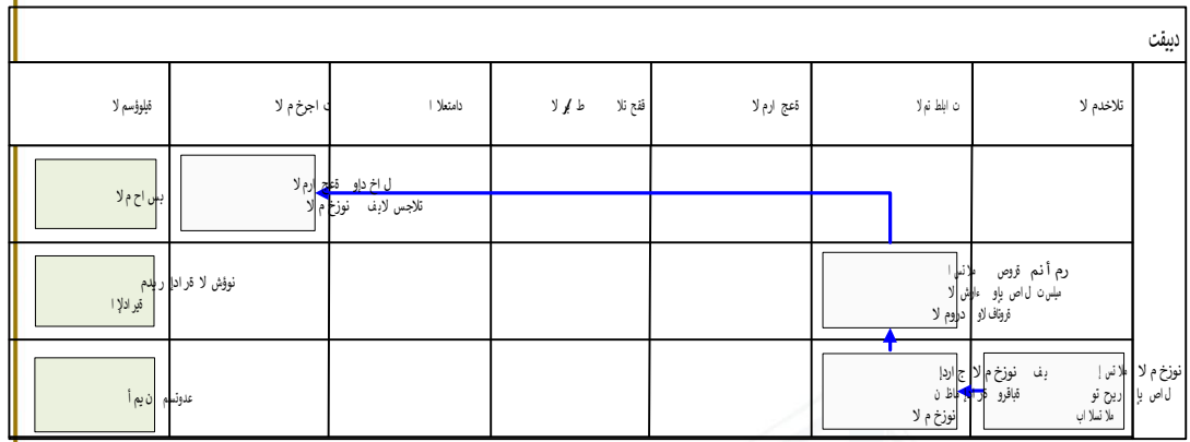
شكل رقم / ٦

يوضح المخطط البياني التالي ( شكل رقم / ٦ ) طريقة تسلسل العمل لتقييد مشتريات المخزون: